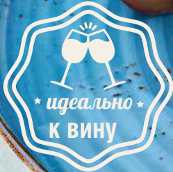
Фруктовая тарелка по сезону